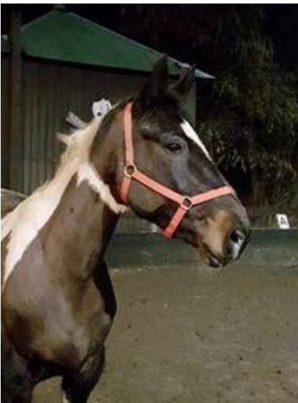
Sally een bonte merrie