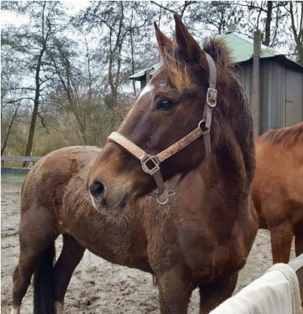
Winnie een koffievos merrie