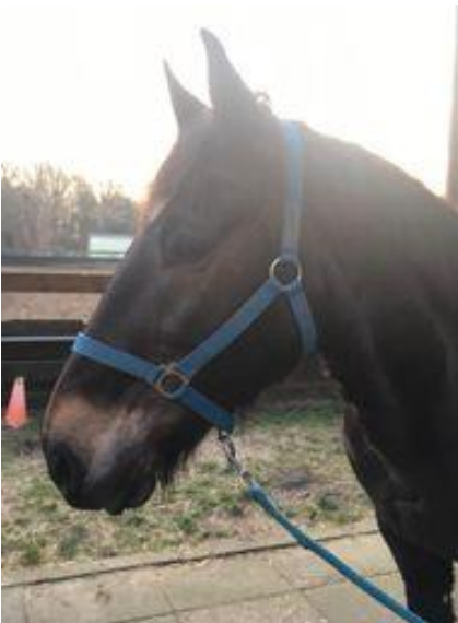
Samuel een bruinzwarte ruin